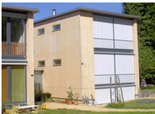
SunCare® 900 sur panneaux-bloc

A l'intérieur comme à l'extérieur SunCare® doit être appliqué directement sur le bois. Il peut être ensuite recouvert avec les produits compatibles comme «SUNBLOCKER» Jet-Finish® UV, PerlColor® et WoodCare® UV.