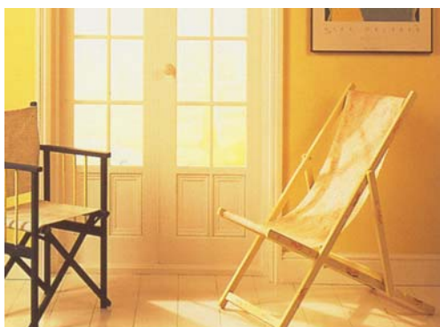
SunCare® et Jet-Finish-SUNBLOCKER